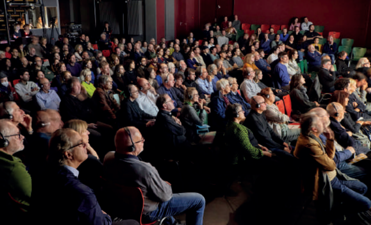
Conférence Amelia Tavella à Karlsruhe, JA 2024