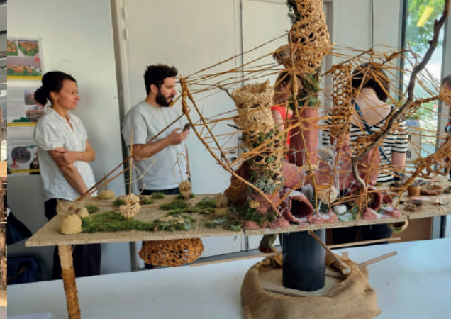
Remise des prix du concours OSCAR 2022/2023 à Strasbourg