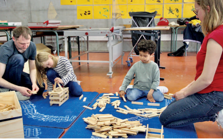
Rencontres européennes de l'architecture 2023