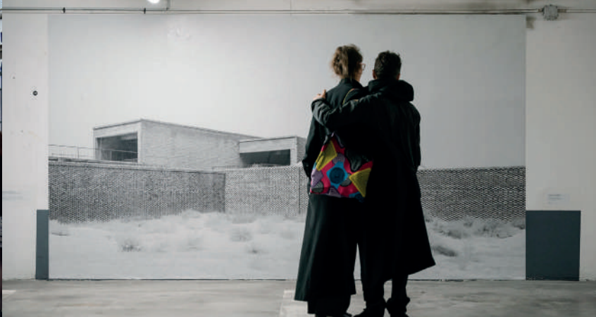
Archifoto 2024 © Alex Flores