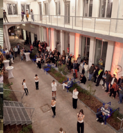
Soirée de lancement des JA 2023