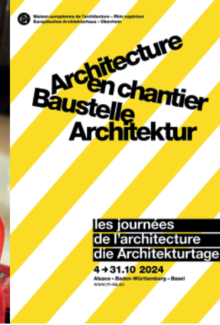
Affiche des Journées de l'architecture 2024 © Dans les Villes