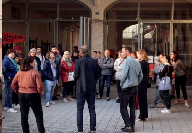
Visite du Kaleidoscoop, JA 2023