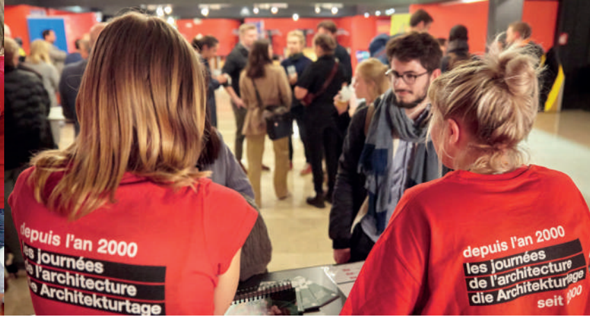
Conférence de Gilles Perraudin à la Briqueterie, JA 2022