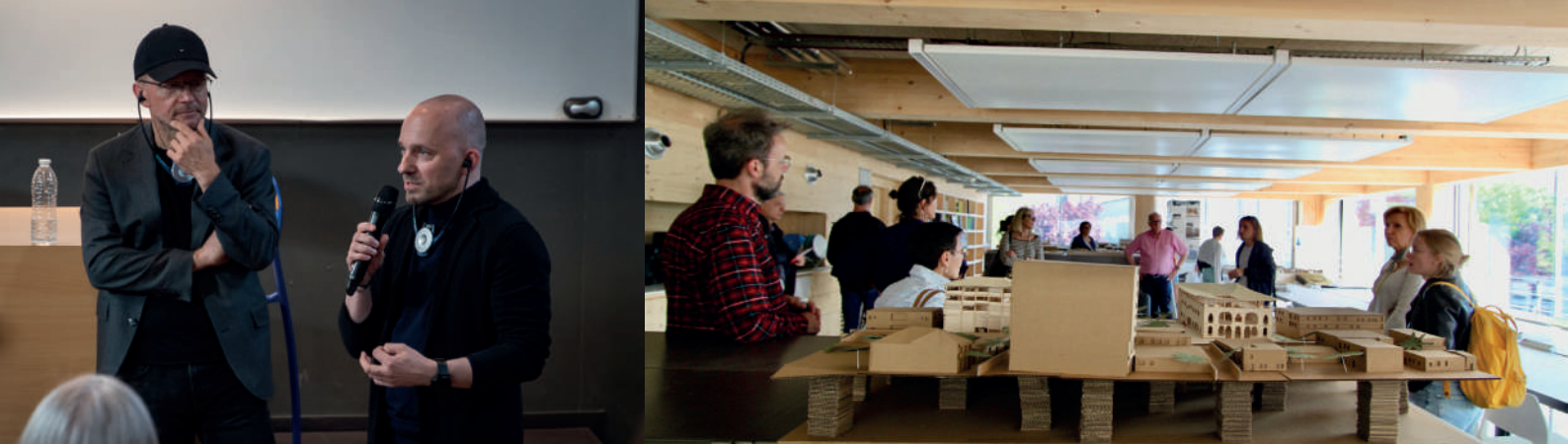
Rencontres européennes de l'architecture 2023