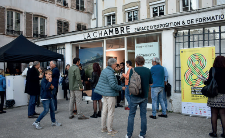
Archifoto 2022 © MEA