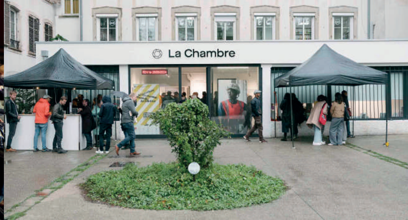
Archifoto 2024 © Alex Flores