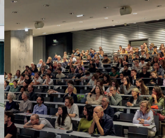
Conférence de Studiolada à Mulhouse, JA 2023