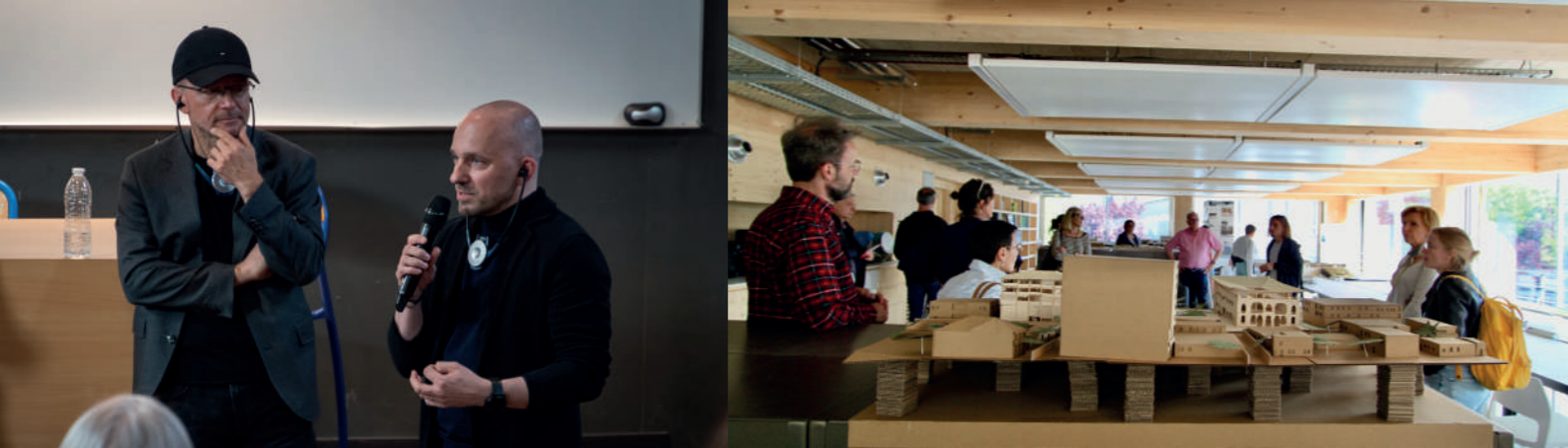
Europäischen Architektur-Begegnungen 2023