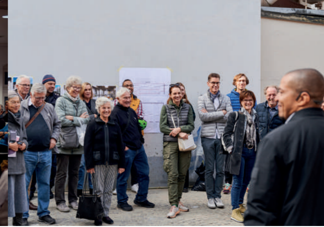
Mittagsführung des Areal Franck in Basel, AT 2023