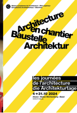
Plakat der Architekturtage 2024 © Dans les Villes