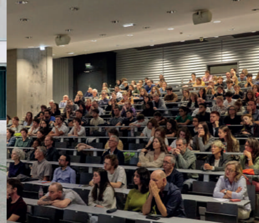
Vortrag von Studiolada in Mulhouse, AT 2023