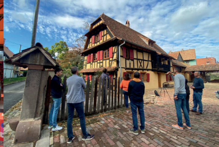
Besuch eines renovierten Hauses in Eckwersheim, AT 2023