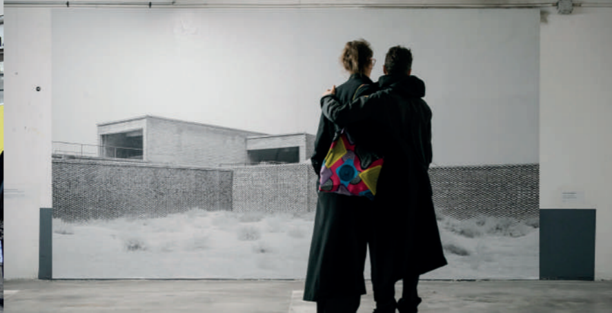
Archifoto 2024