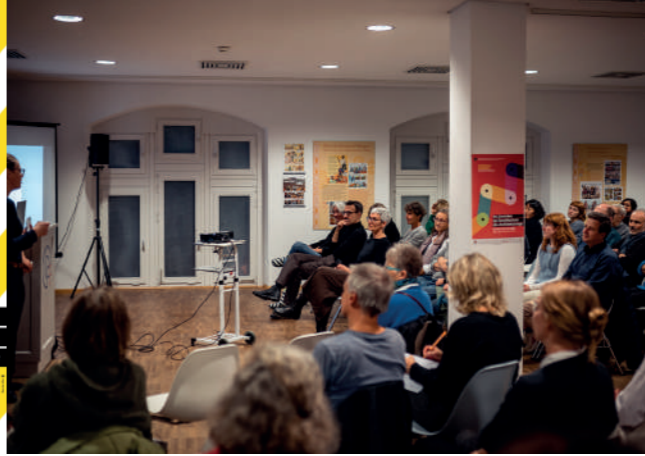
Vortrag des Studios Céline Baumann in Freiburg, AT 2023