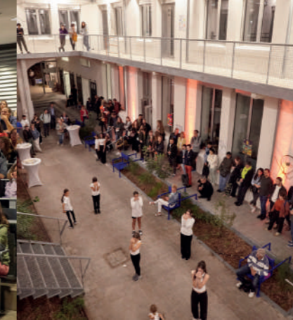
Eröffnungsfeier, AT 2023