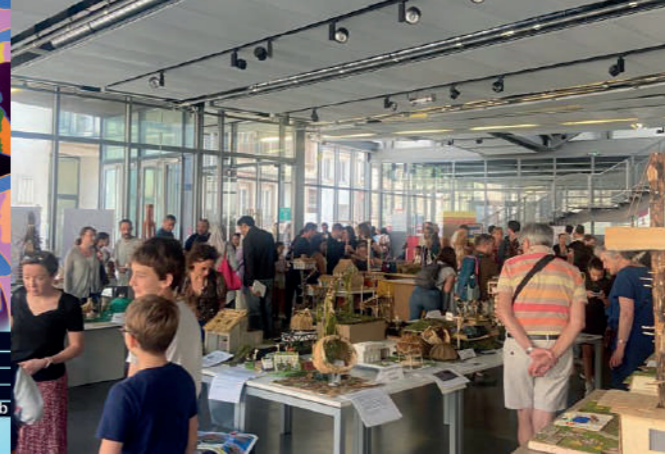
Preisverleihung des Schülerwettbewerbs OSCAR 2022/2023 in Straßburg