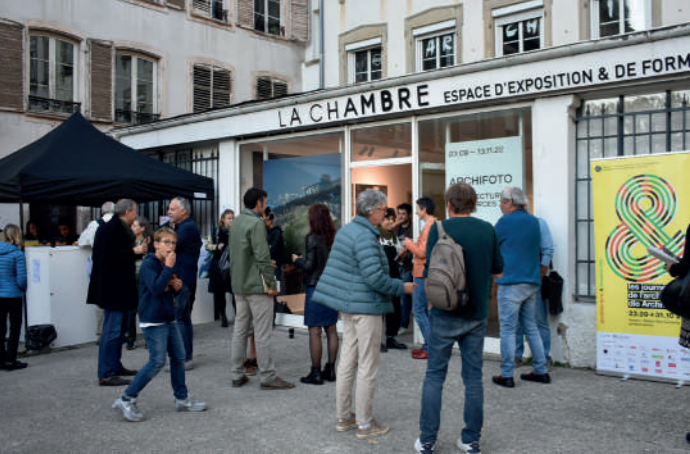
Archifoto 2022 © MEA