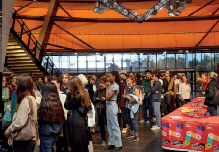
Vortrag von Wang Shu im Zénith Strasbourg, AT 2023