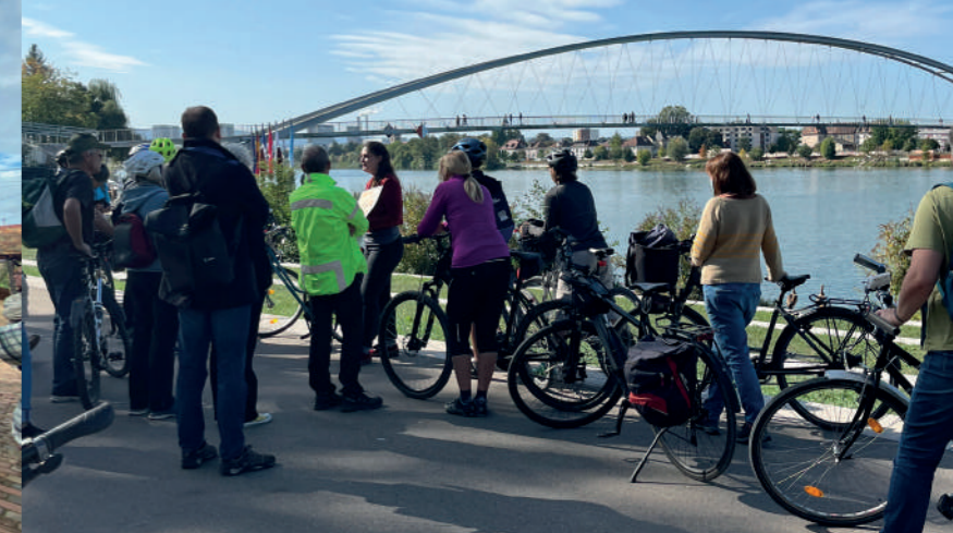
3Land-Tour Transformation eines grenzüberschreitenden Viertels in Huningue, AT 2023