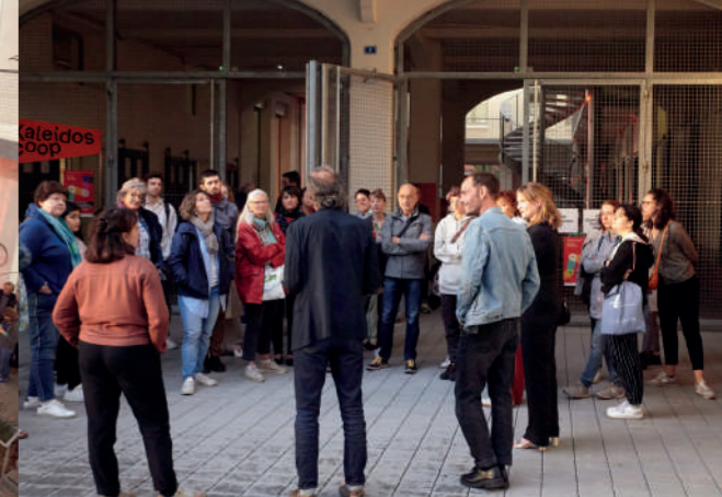
Besuch des Kaleidoscoop, AT 2023