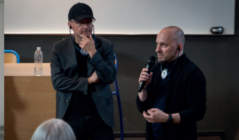
Rencontres européennes de l'architecture 2023