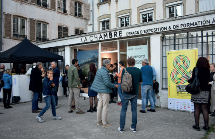
Archifoto 2022 © MEA