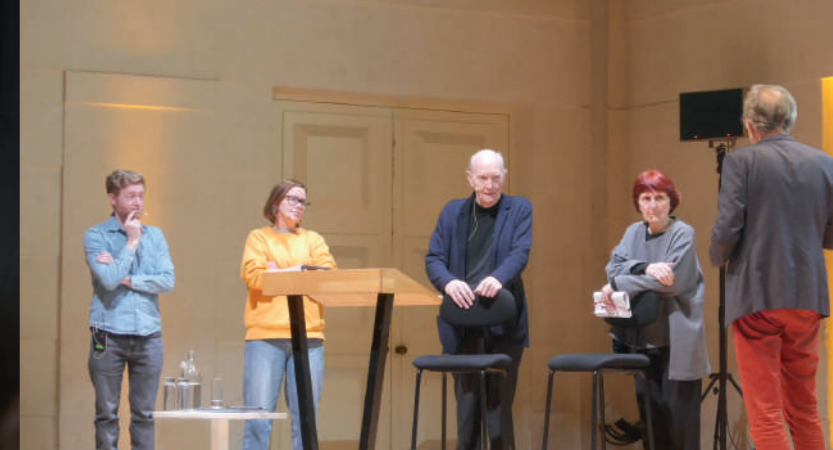
Rencontres européennes de l'architecture 2024