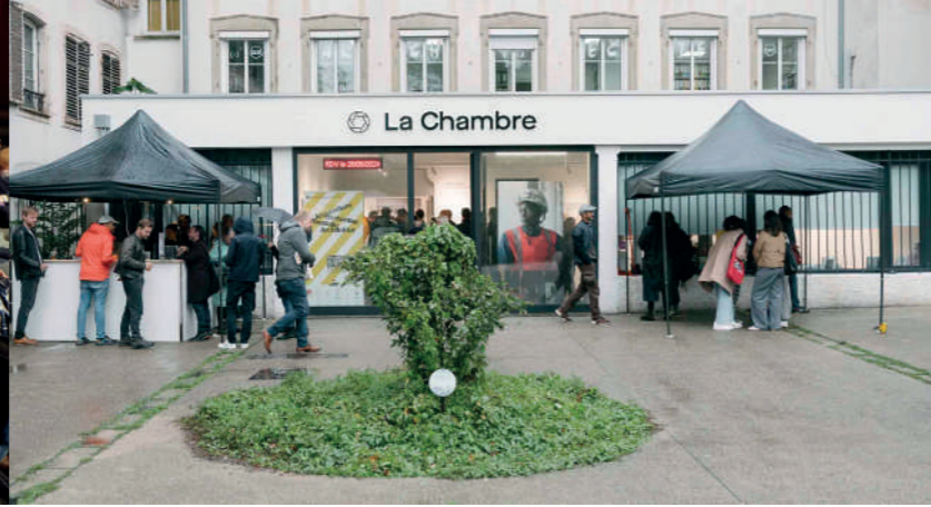
Archifoto 2024 © Alex Flores