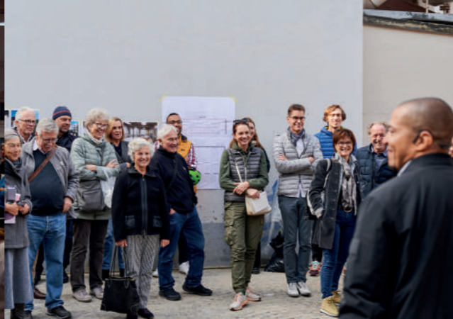
Midi-visite du Site Franck à Bâle, JA 2023