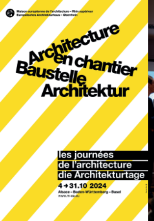
Affiche des Journées de l'architecture 2024 © Dans les Villes