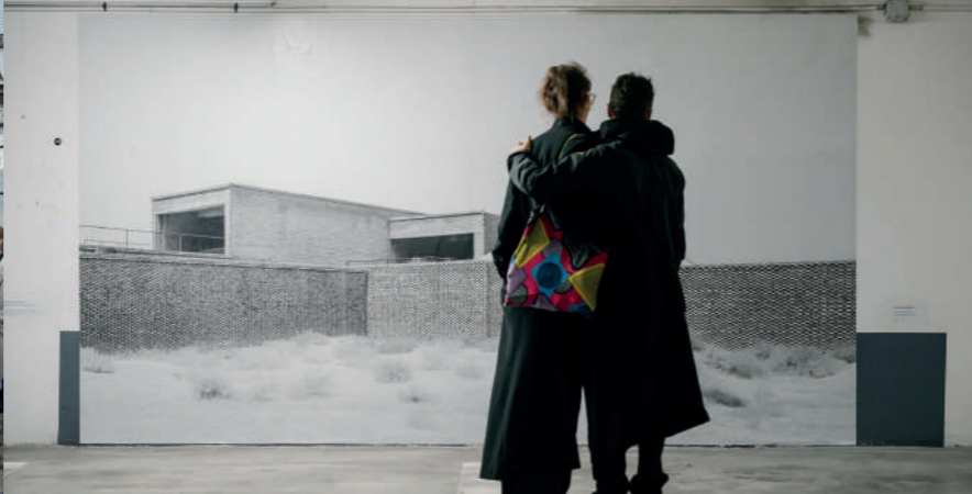
Archifoto 2024