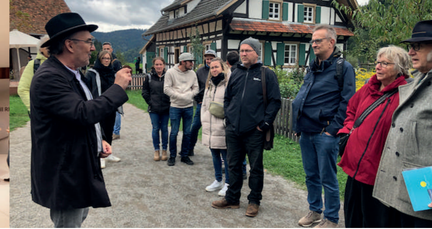
Gutach, JA 2024 © MEA