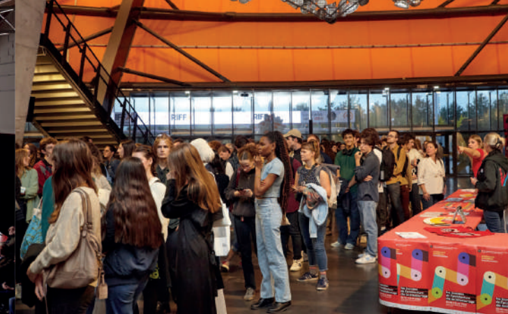
Vortrag von Studiolada in Mulhouse, AT 2023