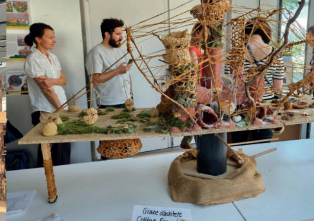
Preisverleihung des Oscar-Schülerwettbewerb 2022/2023 in Strasbourg