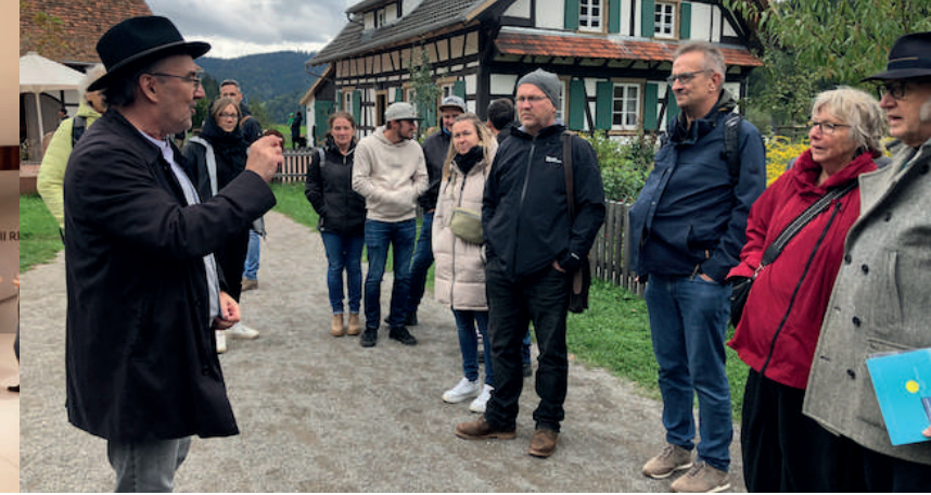
Gutach, AT 2024