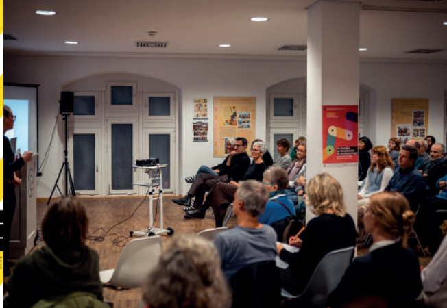
Vortrag von Studio Céline Baumann in Freiburg, AT 2023