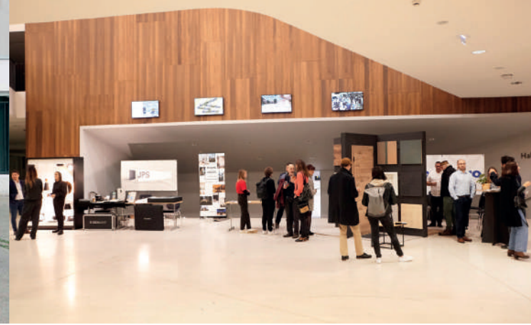
Palais de la Musique et des Congrès in Strasbourg, AT 2024 © Jean-Baptiste Dorner