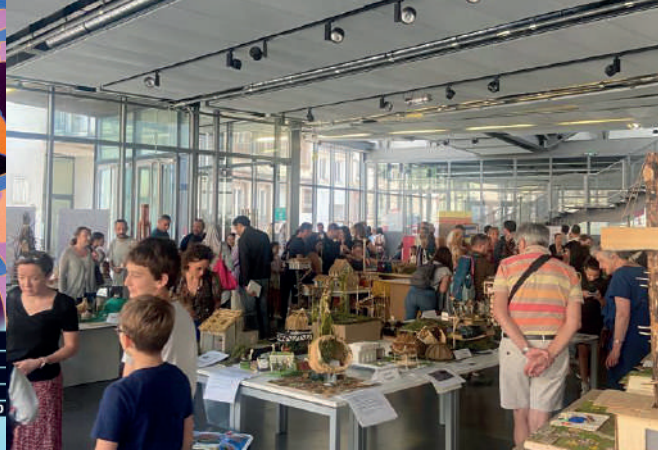
Preisverleihung des Oscar-Schülerwettbewerb 2022/2023 in Strasbourg