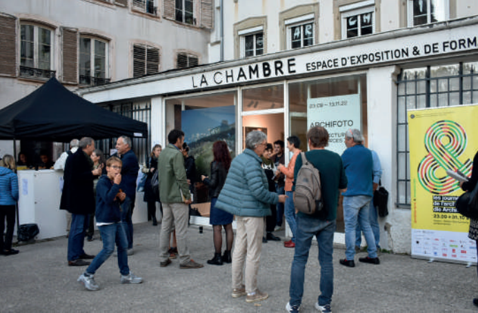
Archifoto 2022 © MEA