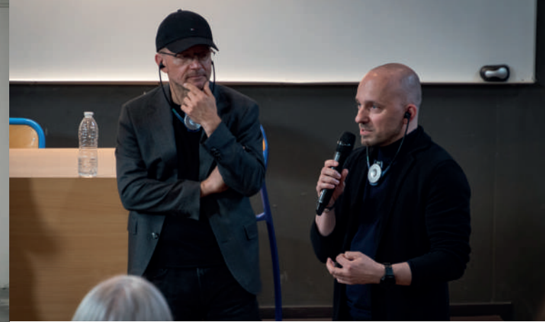
Europäischen Architektur-Begegnungen 2023