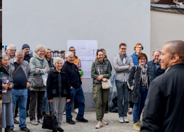
Mittagsführung der Franck Site in Basel, AT 2023