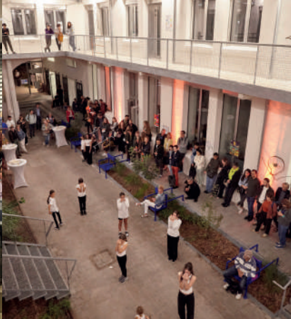
Soirée de lancement des JA 2023