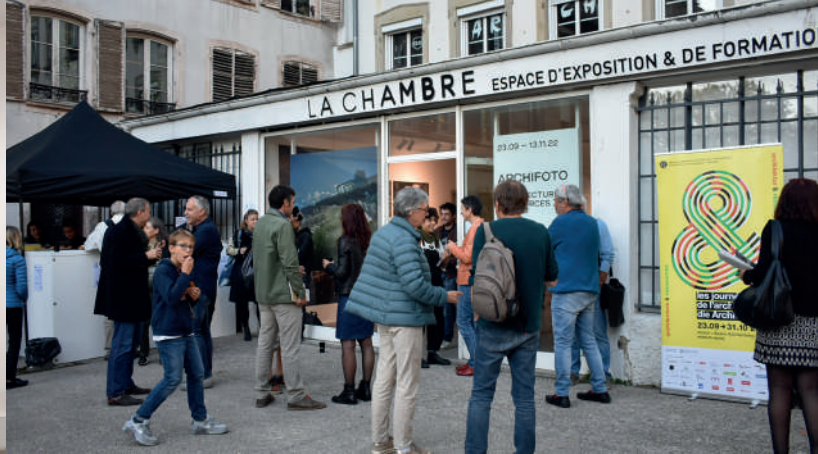
Archifoto 2022 © MEA