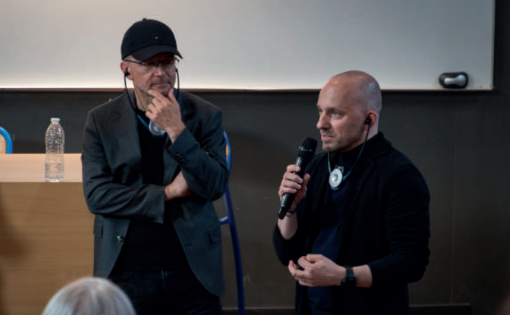
Europäischen Architektur-Begegnungen 2023