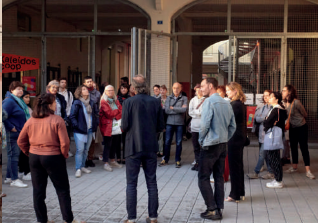
Besuch des Kaleidoscoop