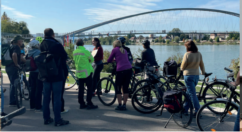
3Land-Tour Transformation eines grenzüberschreitenden Viertels in Huningue