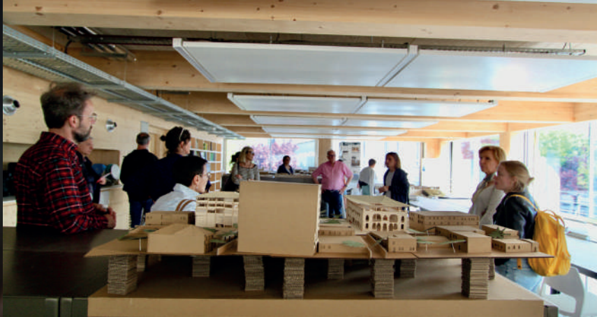
Europäischen Architektur-Begegnungen 2023