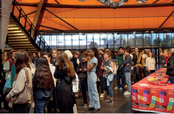
Vortrag von Wang Shu im Zénith in Straßburg