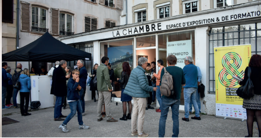
Archifoto 2022 © MEA