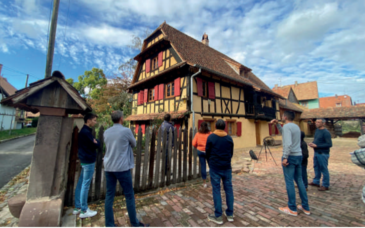
Besuch eines renovierten Hauses in Eckwersheim