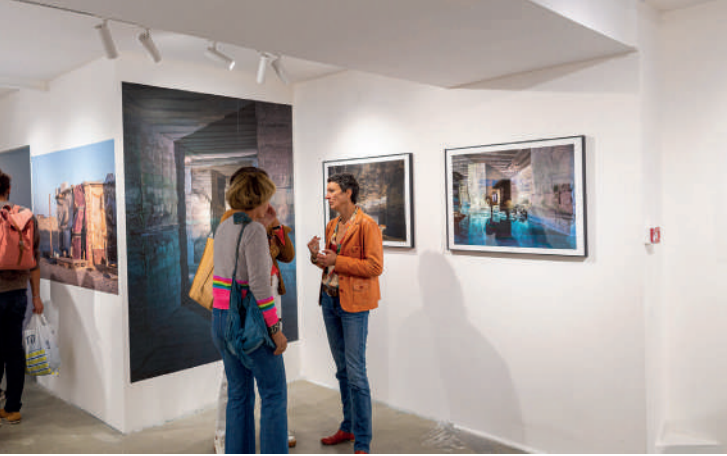
Archifoto 2022