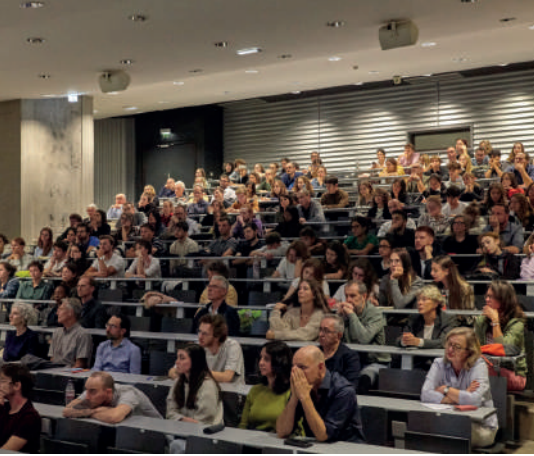
Vortrag von Studiolada in Mulhouse