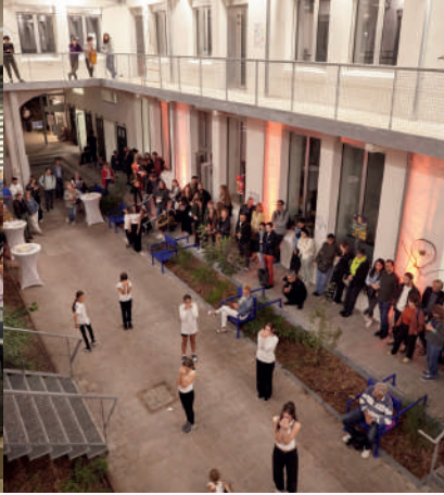
Eröffnungsabend der AT 2023