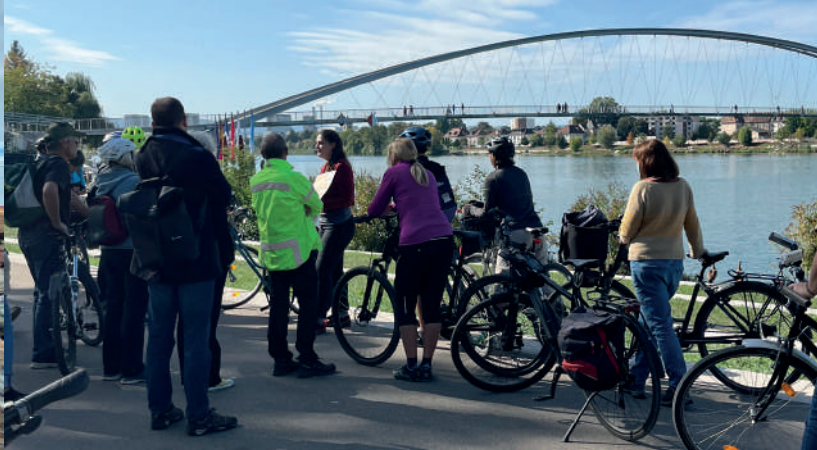
3Land-Tour Transformation d'un quartier transfrontalier à Huningue