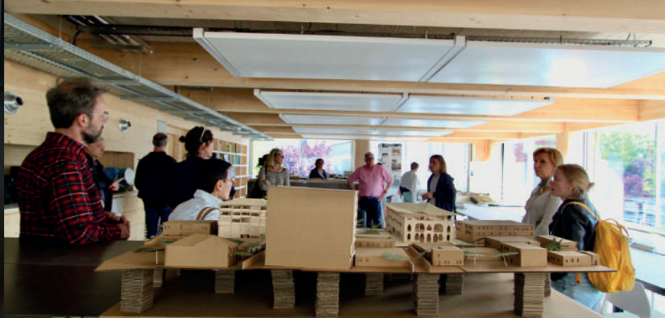
Rencontres européennes de l'architecture 2023