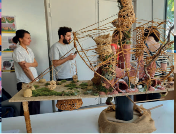
Remise des prix du concours OSCAR 2022/2023 à Strasbourg