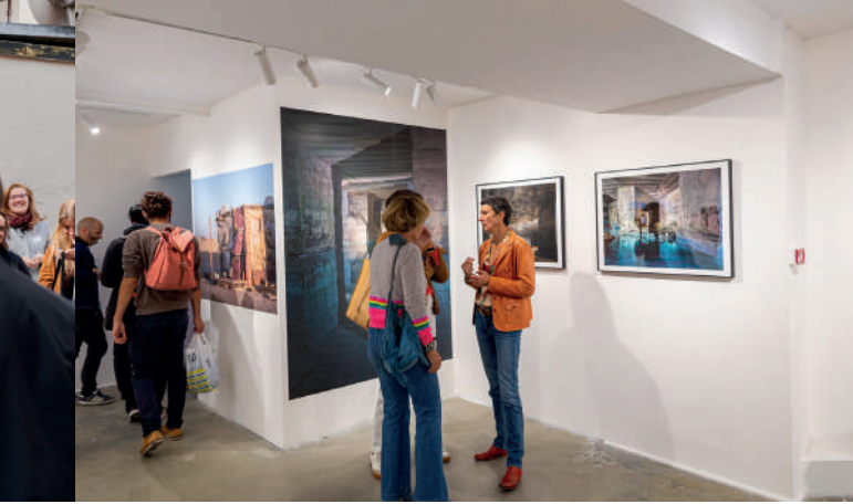
Archifoto 2022 © MEA