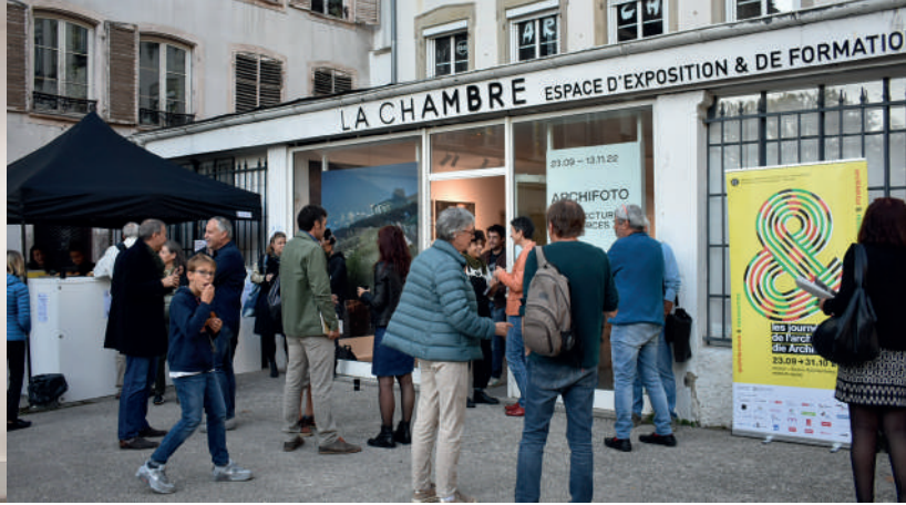
Archifoto 2022 © MEA