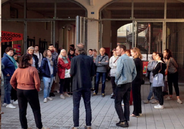
Visite du Kaleidoscoop