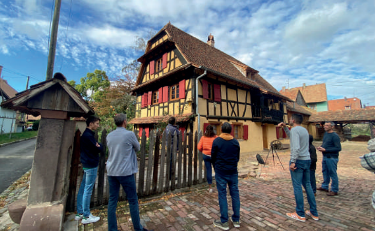
Visite d'une maison réhabilitée à Eckwersheim