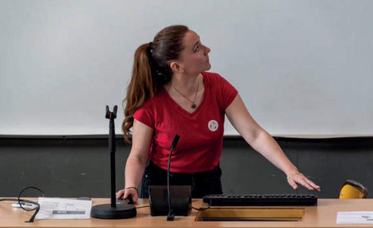
Rencontres européennes de l'architecture 2023