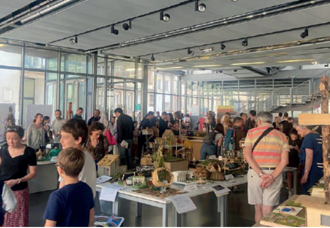
Remise des prix du concours OSCAR 2022/2023 à Strasbourg