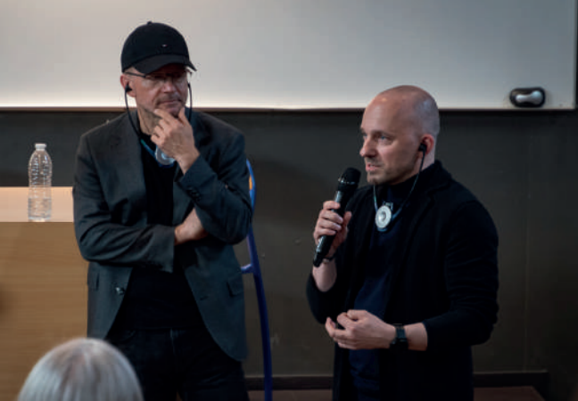
Rencontres européennes de l'architecture 2023